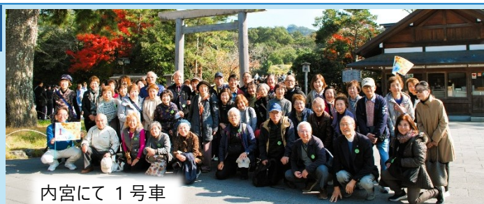
内宮にて 1 号車

帰路は定刻に出発、渋滞があり若干遅延しましたが、大きな事故、怪我もなく全員元気に帰着しました。（企画 G HP に写真を掲載しています）