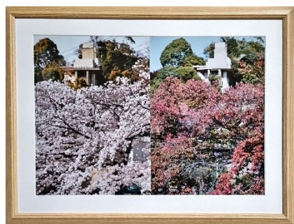
芦屋の春 芦屋の秋 山中 健