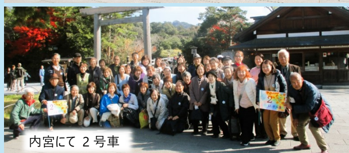
内宮にて 2 号車