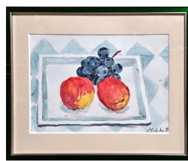
ぶどうとモモ 大西 美知子