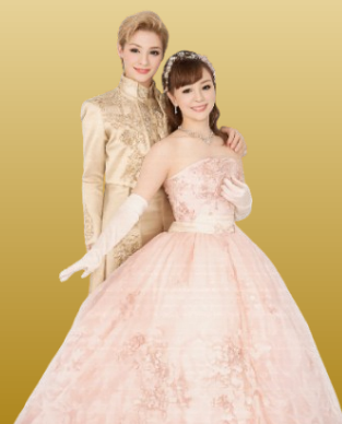
宝塚歌劇団80期生による記念コンサート

★ 参加申込は配布のチラシ申込書に記入し、各同期会の委員へ会費を添えてお申し込みください。申込締め切りは6月12日(金)です。