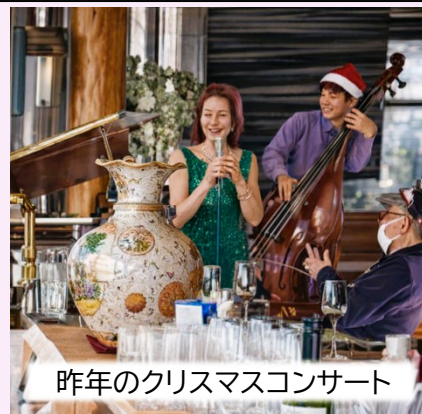
昨年のクリスマスコンサート

先日、第42期の卒業式の日、42期の淑女4人と話す機会がありました。小生は「いい仲間との楽しい日々が待っているよ」と宣伝しておきました。